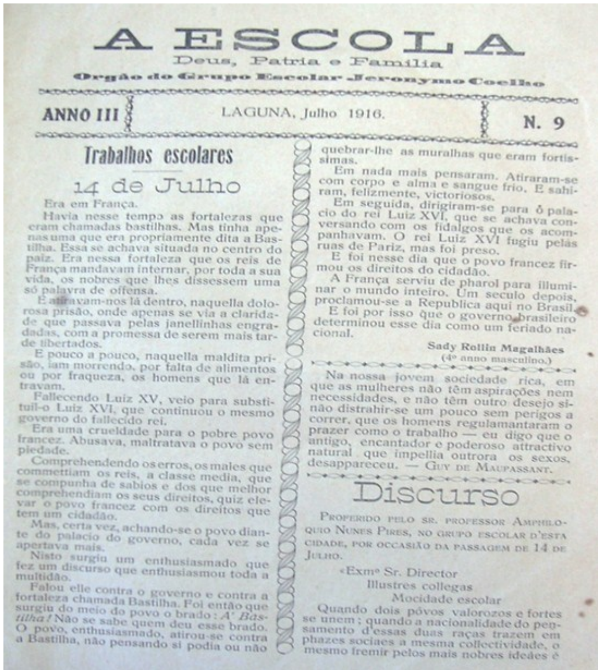
Figura 1 Capa do jornal A Escola , de julho de 1916.