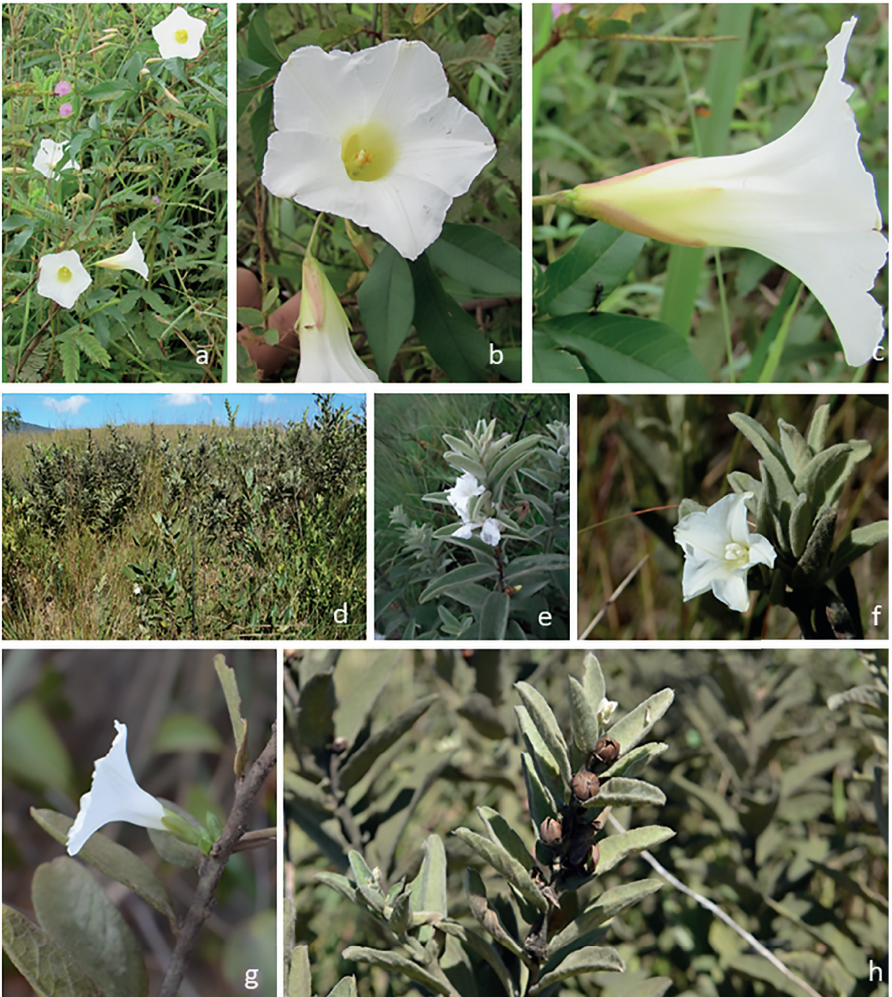
Figura 2. a-c. Distimake macrocalyx . a. Hábito; b-c. Flor. d-h. D. tomentosus . d. População. e. Hábito. f-g. Flor. e. Fruto.