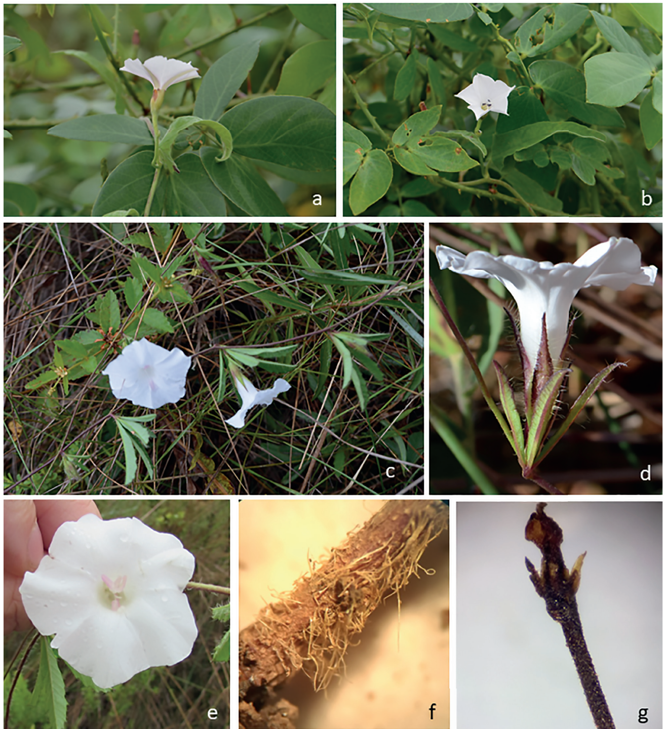
Figura 1. a-b. Convolvulus crenatifolius . flor. c-g. Distimake hirsutus . c. Hábito. d-e. Flor. f-g. Diferenciação do indumento entre a área basal dos ramos e o ápice.