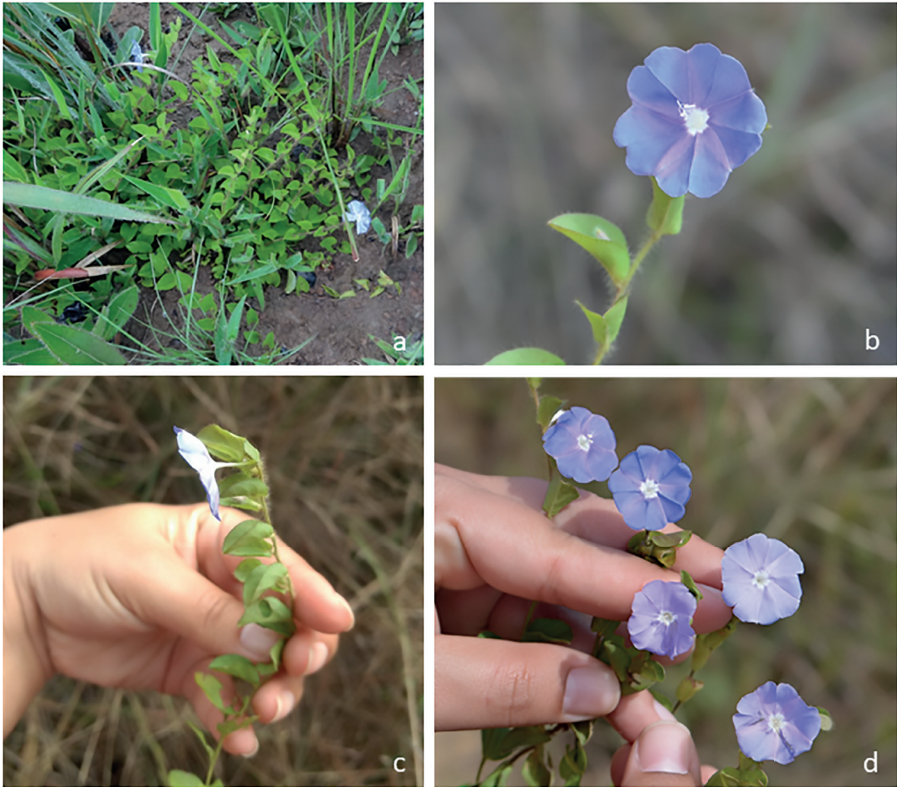
Figura 3. a-d. Evolvulus aurigenus var. macroblepharis . a. Hábito. b-c. Flor. d. Variação de cor da corola numa mesma população.

Subarbusto, raro erva, 0,45-1 m alt.; ramos eretos, vilosos, glabrescentes, tricomas simples