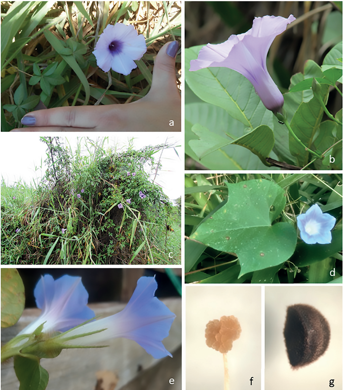
Figura 4. a-b. Ipomoea cairica . a. Hábito. b. Flor. d-g. I. nil . d. Hábito. e. Flor. f. Estigma trilobular. g. Semente trigona.