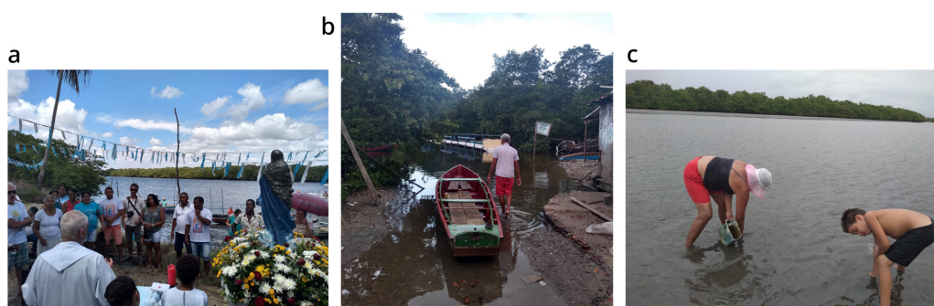
Figura 3. Usos do Rio

A partir do mapeamento e da localização de uma diversidade de usos e formas de apropriação do espaço, o Porto do Capim pode ser qualificado através de suas pluralidades. Enquanto uma região que está no centro da capital paraibana, os trilhos de trem delimitam a fronteira com a região central da cidade, caracterizada pelo fluxo intenso de ônibus, carros, caminhões; marcada pela presença de prédios históricos, praças, instituições públicas, bancos, mercado central, feiras, terminal de ônibus intermunicipal, rodoviária, estação ferroviária e grande fluxo de pessoas transitando durante o dia. O Rio Sanhauá marca a divisão do espaço através de elementos naturais. A fauna e flora presentes no território tornam difícil a tarefa de admitir que estamos no centro da cidade. O rio, o mangue, a pesca, a coleta de marisco e caranguejo, os passeios nas croas 9 , os pássaros, os peixes, macacos, o silêncio. Esses elementos que são o oposto de uma ideia de urbanidade, também estão presentes no território do Porto do Capim (Figura 3).