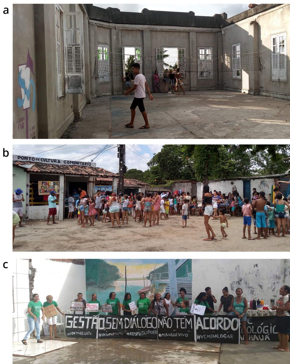
Figura 4. Usos da Rua

trabalham, pessoas que trabalham a noite ou que estão desempregadas. Ao anoitecer, aqueles que retornam do trabalho e as crianças que chegam da escola ocupam as ruas. As crianças com suas bicicletas, brincadeiras de pega-pega e futebol; os adultos sentam-se nos bares e nas calçadas para conversar, ouvir música e tomar cerveja. No entardecer também é possível observar as mulheres acompanhadas de seus filhos ou netos a caminho do culto em suas respectivas igrejas. Por volta da meia noite, as pessoas se recolhem para suas casas (Figura 4).