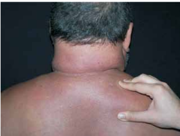
Figura 1. Nítida infiltração cutânea.

Alcian blue: presença de mucina em áreas focais localizadas entre as fibras colágenas da derme (Figura 3).