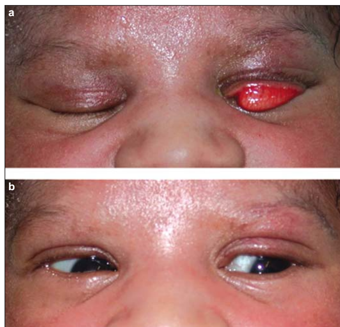
Figura 1 - a) eversão congênita de pálpebra superior esquerda; b) após regressão mecânica

G.S.D., 4 anos, masculino, branco, procedente de Lages (SC), encaminhado por anormalidade palpebral. A criança ha-