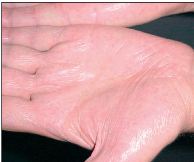
Figura 2 - Angioceratoma

Todos os pacientes negaram uso de: fenotiazina, cloroquina, indometacina, clorfazimina e amiodarona.