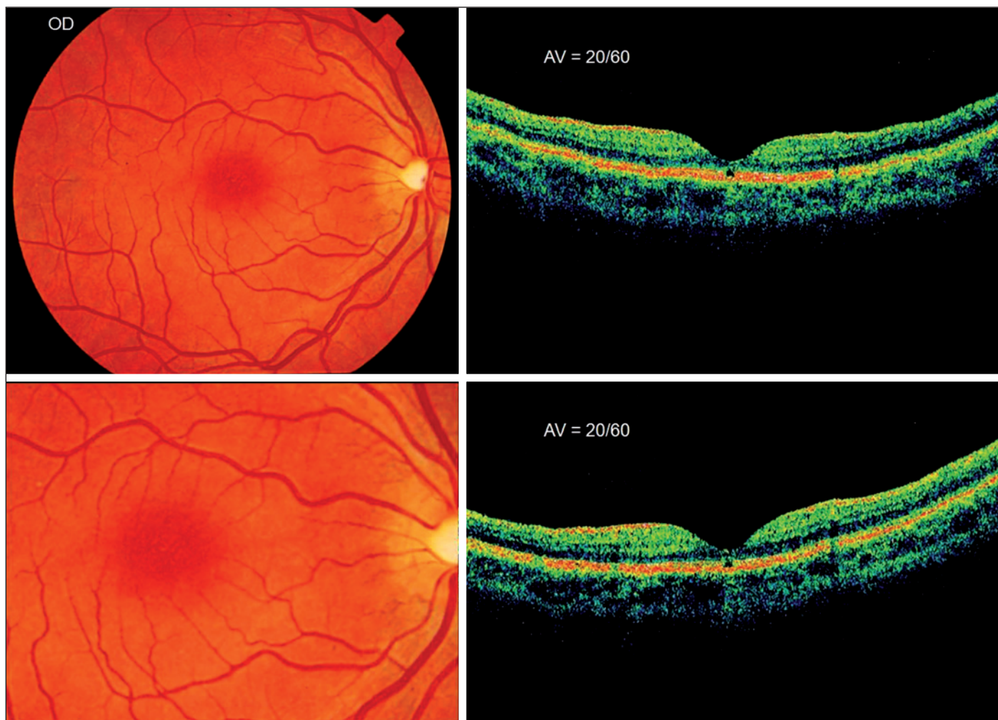
Figura 1 - Retinografia mostra alteração de coloração perifoveolar e OCT evidencia a alteração hiporreflexiva foveal profunda

Na tomografia de coerência óptica, todos os olhos apresentaram uma lesão pequena (<100 micra) e hiporrefletível na região foveal, que acometia as camadas mais profundas da retina, rompendo a linha de alta refletividade externa correspondente à junção dos segmentos interno e externo dos fotorreceptores (Figuras 1, 2 e 3). Não se detectaram alterações da junção hialóide posterior - membrana limitante interna - nos pacientes examinados.