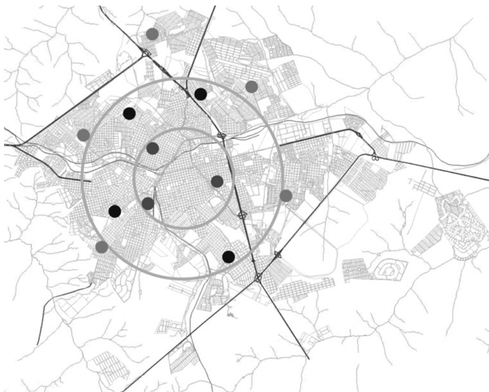
Figura 1. Mapa da cidade de Bauru, divisão dos três setores e representação das doze escolas estaduais que participaram da amostragem.

A amostra pretendida para a pesquisa foi calculada em 1.054 crianças. Entretanto, o total de crianças examinadas foi de 1.749, pois para atingir o número desejado, muitas vezes havia necessidade de examinar uma nova classe e desta sala todas as crianças eram examinadas. A amostra aumentou para não rejeitarmos nenhuma criança, não poderíamos causar frustração em pais e alunos.