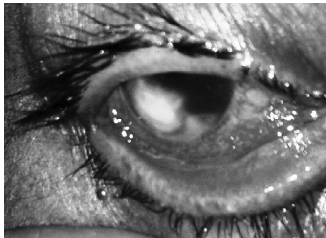
Figura 1. Cuadro clínico típico de queratitis fúngica al examen oftalmológico. Se presenta como un cuadro no doloroso de afección corneal, de bordes irregulares y lesiones satélite asociadas.

Durante los últimos años han surgido nuevas técnicas basadas en la biología molecular, como la reacción de polimerasa en cadena