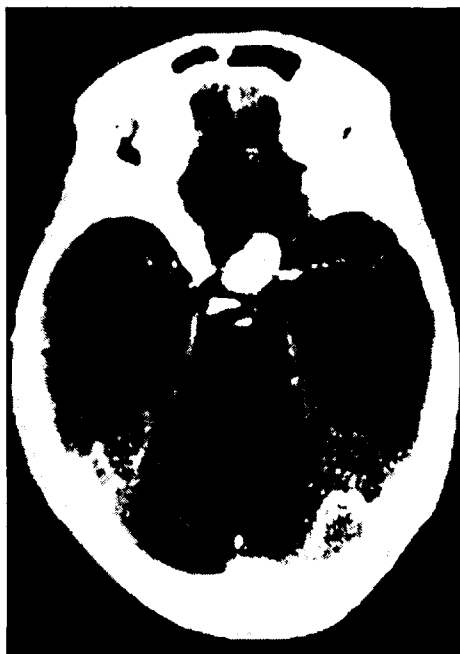
Fig 2. TC com contraste. Corte axial mostrando a metástase de adenocarcinoma mamário para a hipófise.