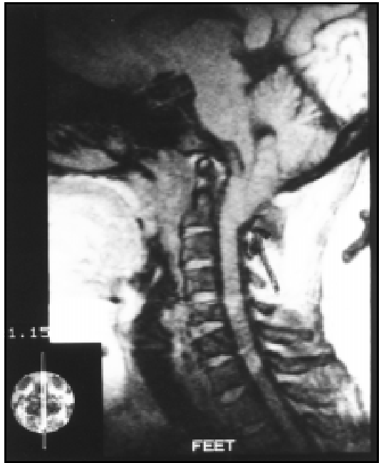
Fig 2. Caso 2, Ressonância magnética da transição encéfalo-medula espinal, plano sagital, demonstrando a presença da malformação de Chiari do tipo I.

Caso 2. Paciente feminina, 49 anos, história de há dois anos do internamento com quadro de vertigem episódica frequente, associado a sensação de tontura não rotatória constante, cefaléia sub-occipital contínua, de moderada intensidade e dificuldade para deambulação. Neste período foi avaliada em vários serviços de neurologia e fez uso apenas de medicações sintomáticas. Ao exame físico geral não foram encontradas alterações dignas de nota, à exceção da observação de pescoço curto. Ao exame neurológico apresentava nistagmo vertical na mirada vertical para baixo (downbeating), discreta dismetria nos membros