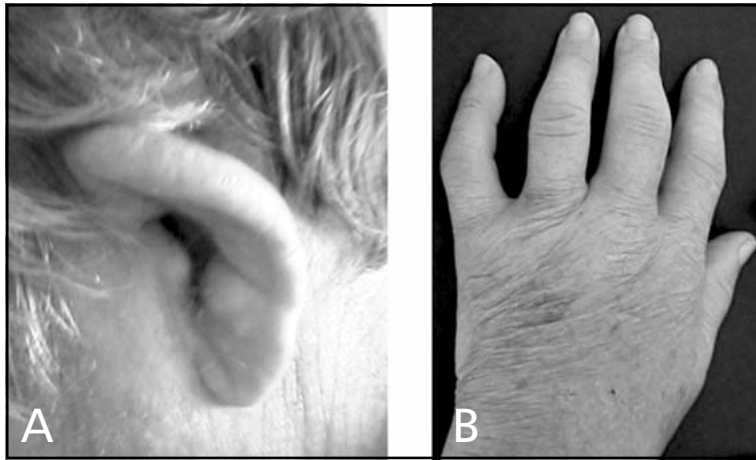
Fig 1. Pré-tratamento: A) aspecto do pavilhão auditivo esquerdo: edema e queda da hélice; B) artrite das articulações metacarpo-falangeanas e interfalangeanas da mão esquerda.