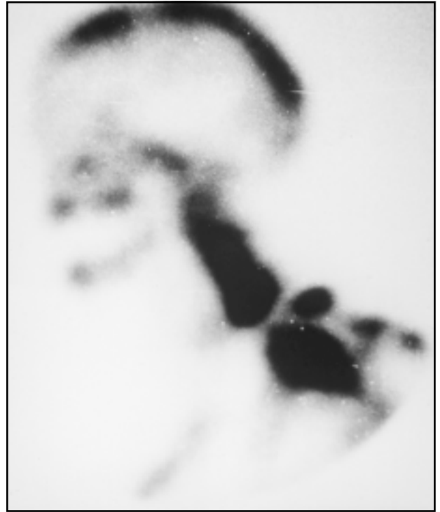
Fig 1. Cintilografia óssea com hiper captação de C5-C6.

Instituiu-se antibioticoterapia intravenosa com ciprofloxacina na dose de 400 mg a cada 12 horas, durante 6 semanas e, posteriormente, por via oral, na dose de 500 mg a cada 12 horas, durante mais 6 semanas. Concomitante ao uso do antibiótico foi realizada imobilização externa com halo-colete por 3 meses, seguido do uso de colar cervical de Philadelphia por 30 dias. A regressão do VSG foi de 84 mm/h, na baixa hospitalar, para 30 mm/h, após 3 semanas de antibioticoterapia intravenosa e para 2 mm/h, no final do tratamento antibioticoterápico. Da mesma forma, os decréscimos dos valores da PCR foram de 48, 21 e 12 mg/dl nas mesmas datas. Após 4 semanas de tratamento, a titulação dos antígenos O e H foram, respectivamente, 1:80 e zero. Uma nova RM de coluna cervical realizada após 3 meses do início do tratamento evidenciou remissão do processo infeccioso (Fig 2B). O paciente apresentou-se assintomático após 3 anos de tratamento.