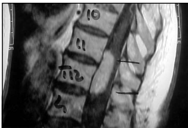
Fig 1. Imagem de ressonância magnética do hemangioma capilar.