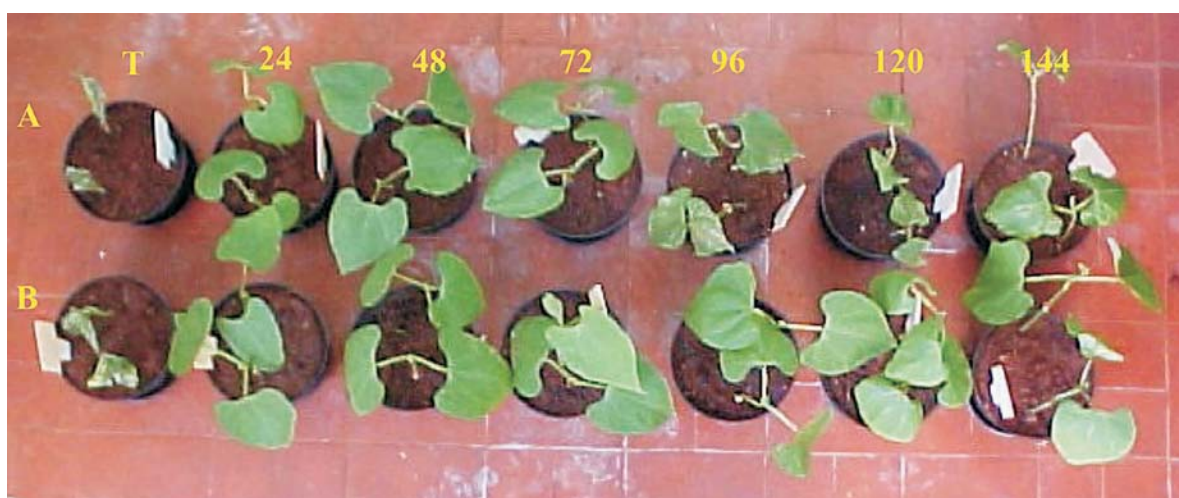
Figura 2. Efeito dos produtos azocyclotin (A) e trifênil hidróxido de estanho (B) sobre a antracnose do feijoeiro, em aplicações de 24 a 144 horas antes da inoculação de Colletotrichum lindemuthianum .

testemunha, que teve a nota máxima de severidade (Figura 2). Com esses resultados verificou-se que a ação preventiva do acaricida azocyclotin sobre a antracnose do feijoeiro proporcionou bom controle da doença. Esse acaricida pertence ao grupo químico dos organo-estânicos, mesmo grupo dos fungicidas trifênil hidróxido de estanho e trifênil acetato de estanho. Observou-se controle da antracnose do feijoeiro com esses dois fungicidas.