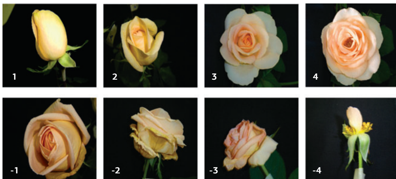
Figura 1. Escala de pontuação adotada do desenvolvimento da abertura das flores (1,2,3,4) e senescência (-1,-2,-3,-4) da rosa 'Osiana'.