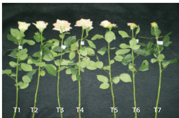
Figura 3. Efeito do etileno sobre a abertura e senescência da flor de rosa 'Osiana' das hastes controle aberto sem etileno (T1), controle do sistema fechado (T2), 0,1 (T3), 1,0 (T4), 10 (T5), 100 (T6) e 1000 \mu\text{L L}^{-1} etileno (T7) por 24 horas.

Letras iguais não diferem entre si pelo teste de Tukey a 5% de probabilidade de erro.