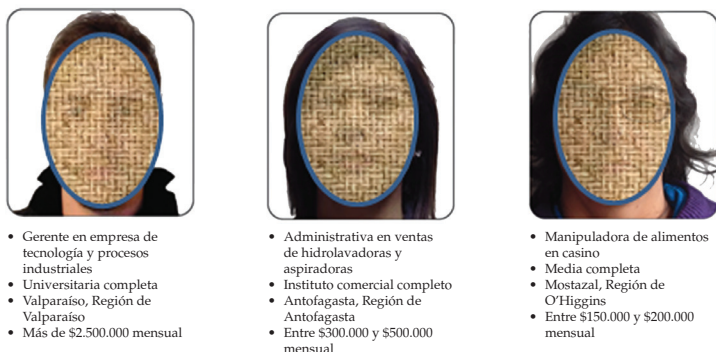
Figura 2 Viñetas representativas de las posiciones sociales subjetivas superior, intermedia e inferior.