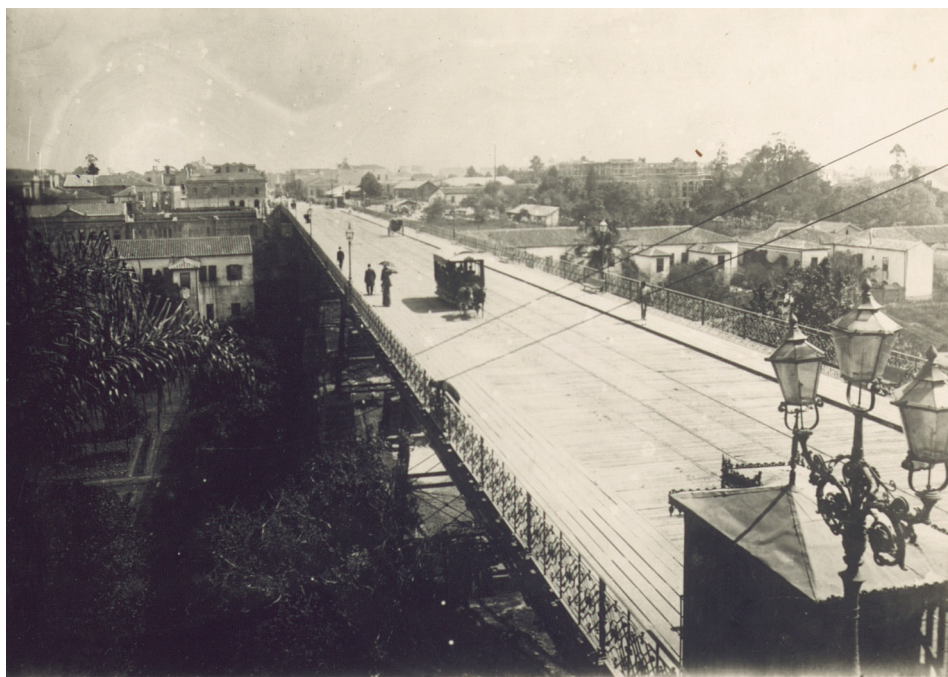
Viaduto do Chá em 1892 e 1893 em direção à Rua Barão de Itapetininga. À direita, ao fundo, início da construção do Theatro Municipal.