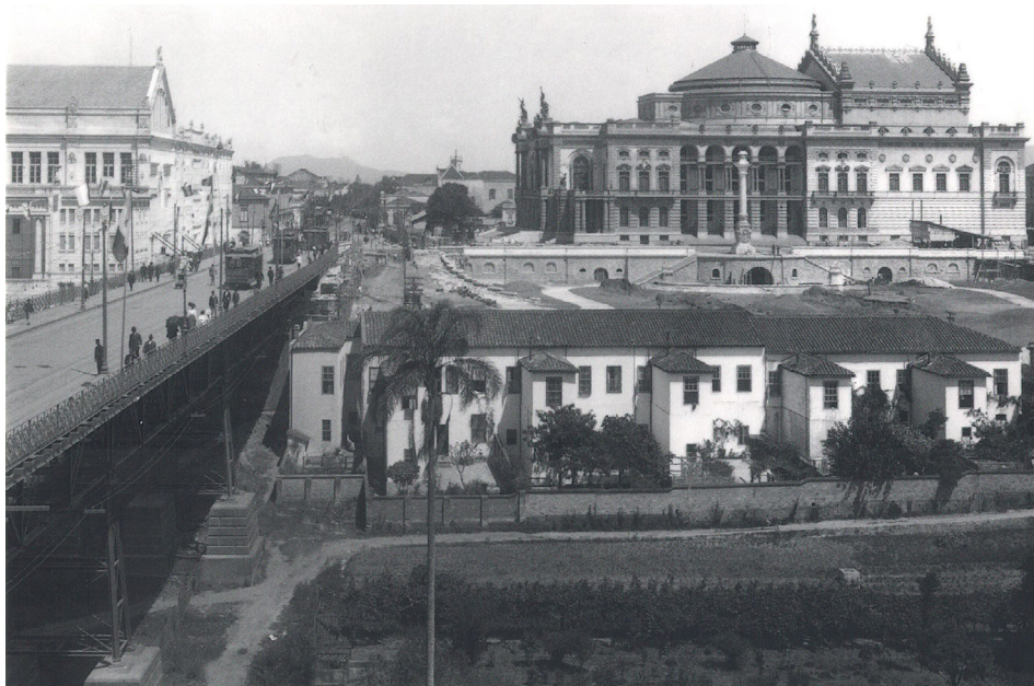
Vista do Vale do Anhangabaú pouco antes da inauguração do Theatro Municipal (1911)