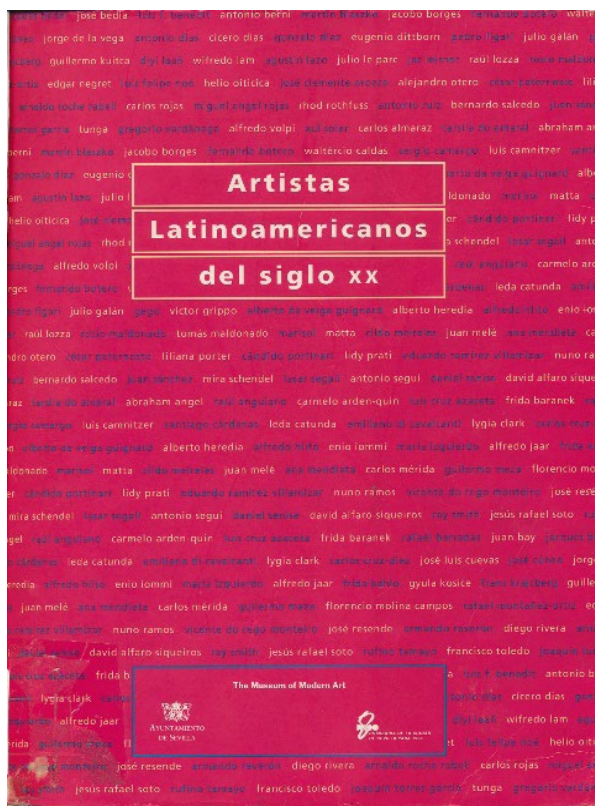
Figura 4 – Cubierta del catálogo de la exhibición Artistas Latinoamericanos del siglo XX, celebrada en la Estación Plaza de Armas de Sevilla, durante la Exposición Universal de 1992

Si bien es cierto, cómo apunta Morethy Couto (2017), que pasarían dos décadas hasta que en Brasil se organizase otro certamen artístico con carácter integrador latinoamericanista – la Bienal del Mercosur en 1997—, este lapsus no eclipsó la defensa por la producción de un arte latinoamericano autónomo, no derivativo o exotizante, por algunos de los intelectuales del país – principalmente Aracy Amaral y Frederico Morais – relacionados con varios de los nombres recurrentes a lo largo de este texto.