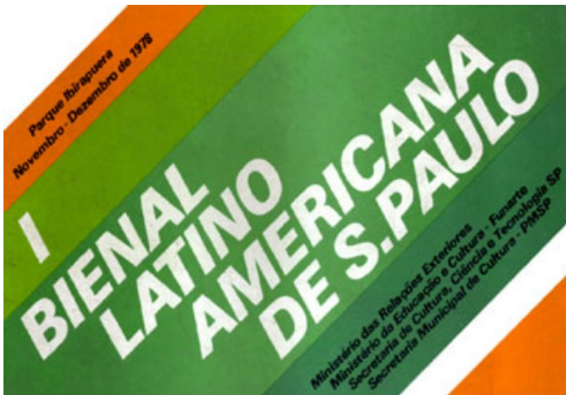
Figura 3 – Cubierta del catálogo de la I Bienal Latinoamericana de São Paulo celebrada en el Parque do Ibirapuera en 1978