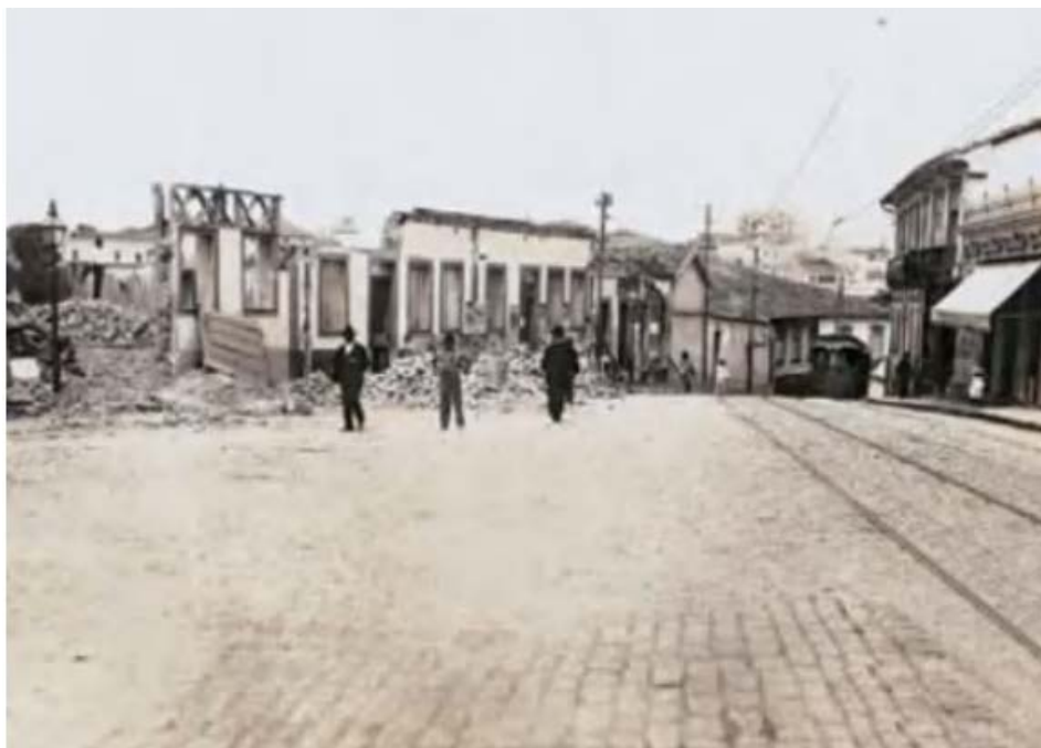
Figura 7 - “Demolição de casas, à esquerda, para construção do viaduto Santa Efigênia”.

João Rubinato nasceu no mesmo ano em que o viaduto Santa Efigênia começou a ser construído. Acendiam-se os motores do progresso. A esperança que ele exalava com os primeiros movimentos de sua marcha inexorável, como a fumaça da locomotiva em sua primeira viagem, encobria os rastros de sua passagem pela cidade. Entre estes estão “os vários registros policiais relativos a suicídio” ocorridos no recém-inaugurado viaduto, que motivaram a “representação endereçada à Câmara pela sociedade Espírita Santo Agostinho” propondo “a colocação de grossa rede de arame em toda a extensão e dos dois lados do viaduto” (OLIVEIRA, 2011, p. 109). Muita gente, naquele momento, vestiu o luto.