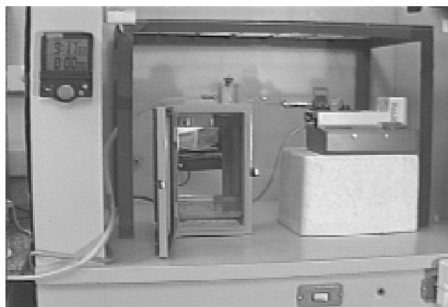
Figura 1 - Modelo de câmara vedada para experimentos com flurothyl. A bomba de infusão acoplada permite gotejo constante da droga. Na parte anterior visualiza-se dispositivo que permite a entrada de ar. A evacuação do agente é realizada através de vácuo-sucção

O limiar (tempo em segundos) para o início da primeira crise clônica e da primeira crise tônico-clônica foi avaliado em P15 e P30. Em P15, não ocorreu diferença estatisticamente significativa entre os grupos, entretanto foi observado que os animais nutridos apresentavam maior limiar para o desenvolvimento de crises convulsivas clônicas e tônico-