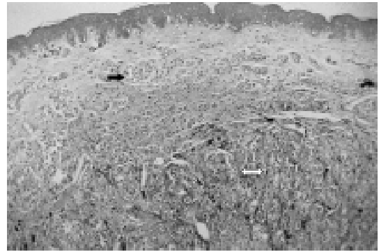
Figura 1 - Melanoma originado em nevo melânico composto pré-existente. Na derme reticular superficial, notam-se células névicas. Na derme profunda, observam-se células melanocíticas malignas, indicadas pela seta branca (40X)

Paciente do sexo feminino, com 12 anos de idade, albina, portadora de síndrome do nevo displásico, apresentava “manchas escuras em dorso” desde os cinco anos de idade. Em consulta com dermatologista, foi submetida à biópsia excisional de lesão pigmentada da pele da região lombar direita, que havia crescido nos últimos meses. O exame anatomopatológico diagnosticou melanoma nível II de Clark e espessura de Breslow de 1,5 mm, originado de nevo melânico composto (Figura 1). Apresentava exame clínico normal, sem visceromegalias ou adenomegalias, e exames de estadiamento (Rx simples de tórax, ultra-sonografia de abdome, hemograma e DHL) também normais.