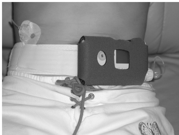
Figura 1 - Bomba de infusão de insulina adaptada ao cinto de menina de 11 anos de idade. À esquerda, acima do cinto, pode ser observada a cânula subcutânea

O uso de análogos de ação rápida em CSII é superior ao de insulina regular, com uma taxa reduzida de hiperglicemia pós-prandial e de hipoglicemia noturna 30,31 . A insulina lispro, a aspart e a glulisine são todas aprovadas para uso com CSII nos EUA e em muitos outros países 32 . Interromper a taxa basal de insulina (suspendendo ou desconectando da bomba) durante exercícios físicos mostrou ser eficaz em reduzir hipoglicemia nas crianças com DM1 26 . Embora não haja nenhuma