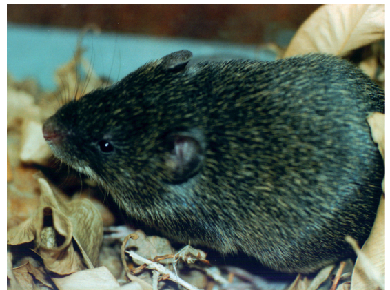
FIGURA 1: Indivíduo de Abrawayaomys ruschii coletado e analisado no presente estudo – MN 67557.

arredondadas e lisas, desprovidas de cristas; jugal presente, processos maxilar e esquamosal do zigoma não se sobrepondo; placa zigomática estreita e com a borda anterior arredondada, com incisão indistinta (Figura 2a). Forame incisivo curto, não ultrapassando o primeiro molar, com suas margens laterais retas e paralelas (Figura 2b). O padrão de circulação da carótida ( sensu Carleton, 1980) é primitivo (tipo 1 de Voss, 1988), com a presença do forame estapedial, ausência da abertura posterior do canal carotidiano e sulco esquamosal-alisfenóide e forame esfenofrontal presentes. Barra do alisfenóide ausente. Processo capsular do incisivo inferior presente e bem desenvolvido, formando uma elevação conspícua na crista massetéica superior. M 1 com flexus mediano anterior ausente, procingulum formando um arco único. Parafossettus na