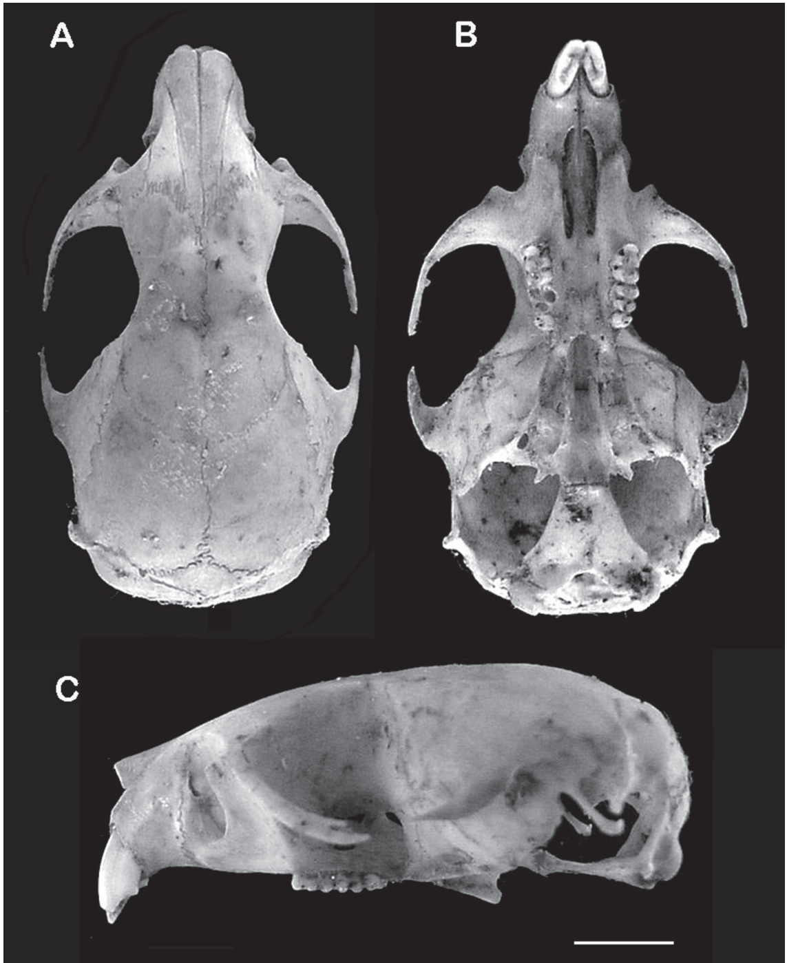
FIGURA 2: Vistas dorsal (A), ventral (B) e lateral (C) do crânio do espécime MN 67557. Barra corresponde a 5 mm.

autossômicos (NA) após análise de várias metáfases pois não foi possível a identificação do par sexual em consequência da má qualidade da preparação. O complemento cromossômico é composto de 25 pares de cromossomos acrocêntricos que variam de tamanho