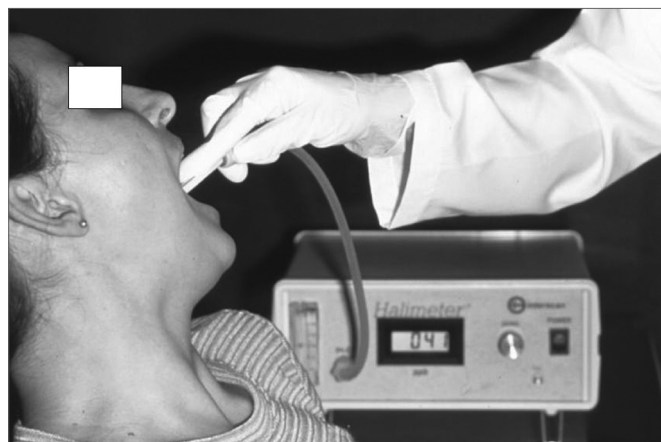
Figura 2. Técnica da halitometria - ilustração do procedimento para medir os compostos sulfurados voláteis com o halímetro.

Foram desenvolvidos aparelhos para avaliação objetiva do mau hálito. Estes aparelhos são úteis para detectar CSV quantitativamente, além de correlacionar a sua presença com doenças específicas e seu impacto sobre a qualidade e intensidade do mau odor 4 . O halímetro é o aparelho mais usado atualmente em pesquisas sobre halitose. Ele contém, em seu interior, um circuito elétrico e uma bomba para aspirar amostras de ar através de um sensor eletroquímico voltimétrico, que gera sinais elétricos quando exposto aos CSV. Quando os CSV atingem o sensor, eles se ionizam, e a oxidação dos compostos pode ser proporcionalmente lida como concentração em partes por bilhão (ppb) do gás ionizado. É considerada halitometria normal abaixo de 150 ppb (Figura 2). O halímetro não