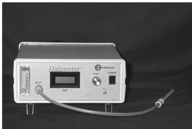
Figura 1. Halímetro: medida objetiva dos compostos sulfurados voláteis.

O teste subjetivo de detecção da halitose, também chamado de teste organoléptico, é de utilidade limitada, pois depende da capacidade olfatória do examinador. Condições climáticas ou afecções que diminuam a sensibilidade do examinador podem mascarar o diagnóstico de halitose 10 . O paciente é solicitado a vir ao consultório durante o período em que sentir o seu hálito pior. Pedese ao paciente também que não use enxaguantes bucais, dentífricos, por pelo menos duas horas antes do teste. O teste organoléptico consiste em pedir ao paciente para respirar profundamente pelas narinas e expirar pela boca, enquanto o examinador avalia o ar expirado colocando-se a uma distância de aproximadamente 20 cm do paciente e considera desagradável ou não em uma escala de 0 a 510. A auto-avaliação pode ser relevante por envolver o paciente no processo. Passar a língua no próprio punho e sentir o odor em seguida reflete a contribuição da saliva na produção do mau hálito. Como o teste organoléptico é uma medida subjetiva, o examinador de usar um teste