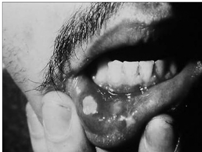
Figura 2. Afta major em lábio inferior. Repare nas lesões cicatriciais

As principais hipóteses fisiopatológicas da origem das lesões da EAR são de a doença estar ligada a alterações na imunidade humoral ou celular 4,15-20 . A maioria dos estudos citados acima, entre outros exames, lançou mão de imunofluorescência direta (IfD) para tentar comprovar a presença ou ausência de depósitos de imunocomplexos na mucosa de pacientes portadores de EAR.