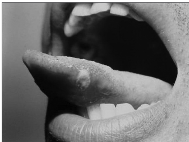
Figura 1. Afta minor em borda lateral da língua

A doença pode se manifestar de três formas. A forma minor é caracterizada por pequena úlcera com tamanho de três a 10 milímetros de diâmetro, localizando-se em mucosa não-queratinizada, surgindo isoladamente ou até mesmo em grande quantidade na cavidade bucal 2,3 (Figura 1). A forma major caracteriza-se por apresentar extensa úlcera dolorida, com mais de 10 milímetros de diâmetro. Localiza-se também em mucosa queratinizada, normalmente de forma isolada, chegando a levar mais de 15 dias a um mês para completa cicatrização, podendo deixar cicatrizes na mucosa (Figura 2). A terceira forma é a herpetiforme, que apresenta como característica o surgimento de várias úlceras pequenas que se coalescem, sendo a forma mais rara da doença 2,3 .