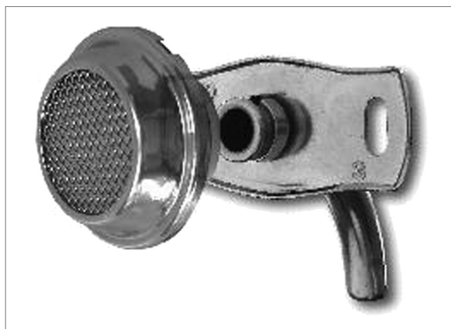
Figura 1. Válvula Fonatória acoplada à cânula de metal.

A VF desenvolvida apresenta diafragma, filtro e conexões plásticas montadas dentro de um corpo em aço inox (Figura 1). É adaptável para todas as cânulas metálicas nacionais (Figura 2) por via anterógrada, através de encaixe do adaptador da VF ao cabeçote da cânula interna da cânula de traqueotomia. Apresenta um adaptador para cada número de cânula de traqueotomia. Foram testados diafragmas de 40, 50 e 60 Shores (resistência de abertura da válvula), sendo o diafragma de 40 shores o de menor resistência. Todos os pacientes iniciaram o uso da válvula com 50 shores e, após a primeira semana, de acordo com a dificuldade de inspiração poderiam fazer uso do diafragma