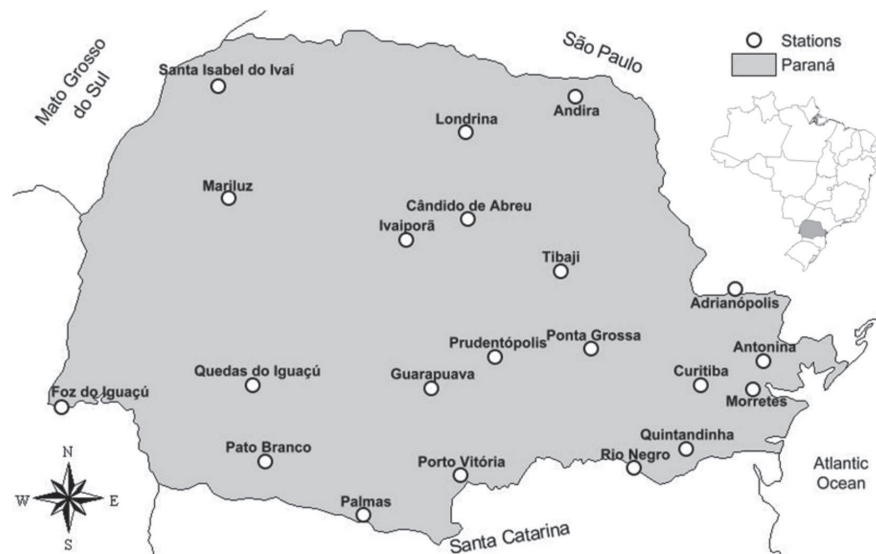
Figura 1. Localização geográfica das estações hidrológicas utilizadas no estudo e localizadas no Estado do Paraná.

x_1 e x_2 = média da chuva anual do período de 1961-1990 e 1991-2006, respectivamente;