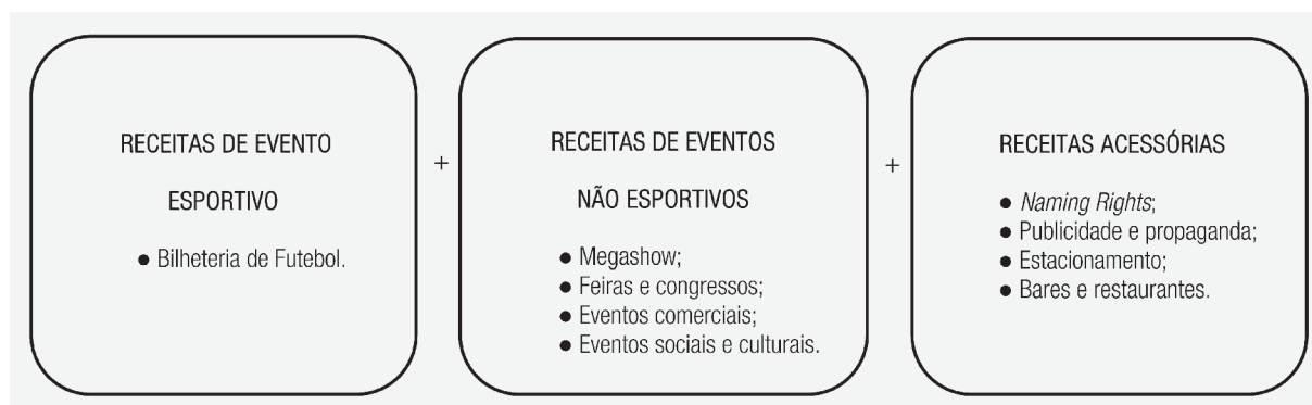
FIGURA 1 POSSIBILIDADES DE GERAÇÃO DE RECEITAS DAS ARENAS PPP E ARENAS PRIVADAS

Com base no indicador de receitas diversificadas, verifica-se que as arenas PPP e as arenas privadas apresentam um grande potencial para geração de receitas operacionais alternativas (figura 1), ao passo que as arenas esportivas sob a gestão pública tradicional não podem cobrar outras receitas adicionais na exploração comercial do equipamento público, devido aos limites impostos pela Lei Federal nº 8.666/1993. Dessa forma, os atores privados podem reduzir as incertezas associadas às receitas operacionais oriundas da bilheteria de futebol (Cabral e Silva Jr., 2013). A obtenção de tais receitas requer uma estrutura empresarial, cujas competências são raramente encontradas no seio da administração pública tradicional, o que demonstra o potencial das PPP comparativamente à provisão pública tradicional.