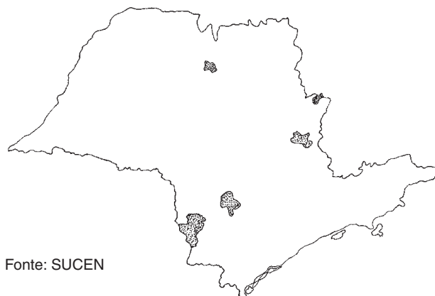
Figura 3 - Presença de Triatoma infestans (reintrodução da espécie) no Estado de São Paulo, 1985 a 1994.