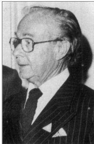
Carlos Chagas Filho. 1910-2000.