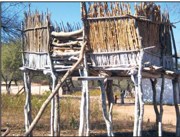
Figura 2 - Aspecto de pintura em peridomicílio (depósito rústico de grãos, Camiri 2007).