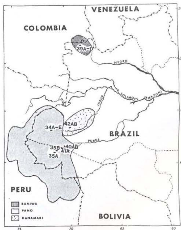
Fig. 1 — Mapa indicativo da localização atual das tribos e vilas. Ver texto para maiores detalhes.

Arawak localizado na parte superior do rio Purus. O terceiro grupo, objeto de nosso estudo, constitui uma tribo independente cuja língua, Katukína, não mostra relação estreita com outras línguas da área; Greenberg (1960) classificou a língua como pertencente à família Macro-Tucanovan, da qual outros componentes são representados pelos Tikuna e Tukano. Eles são uma pequena tribo estimada em um número de cerca de 800 pessoas que vivem em 9 vilas localizadas na área mostrada na Fig. 1, com uma longa história de contatos com neobrasileiros. Nossos estudos foram realizados em uma localidade da Missão Novas Tribos conhecida como Três-Unidos no Mamoré-Creek, um tributário do rio Juruá, cerca de 25 milhas aéreas a leste da cidade de Eirunepé; coordenadas aproximadas: 6^{\circ}37'S e 69^{\circ}32'W (ver Fig. 1). A amostra foi obtida de elementos de três vilas totalizando cerca de 130 pessoas, as quais são moradoras dessa localidade desde o estabelecimento da missão em 1967. Esta tribo nunca foi intensivamente estudada etnograficamente, sendo caracterizada por um úni-