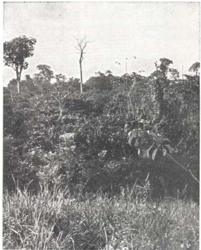
Fig. 3 — Gastos com o controle de crescimento de capoeira podem ser anti-econômicos. Pastagens abandonadas, tais como esta perto de Paragominas, não são raras.

Exames dos resultados do solo, apresentados no relatório final do estudo da Belém-Brasília, revelam algumas indicações de que a produção de pastagem pode não ser tão sustentável quanto a conclusão do relatório indicaria. A parte do problema de invasão de ervas daninhas, o qual o relatório menciona por alto (Falesi, 1976), as próprias mudanças do solo não são totalmente favoráveis às pastagens. Os dados do experimento de adubação da pastagem em Belém (Serrão et al. , 1971), que foram analisados em outra publicação (Fearnside, 1979a), indicam que o fósforo é o elemento que melhor prediz a fertilidade do solo para produção de capim nas condições do experimento. O pH e outros indicadores, para os quais os efeitos "benéficos" da pastagem foram achados, não são tão relevantes para produção da mesma. Os dados apresentados no relatório do estudo da Belém-Brasília