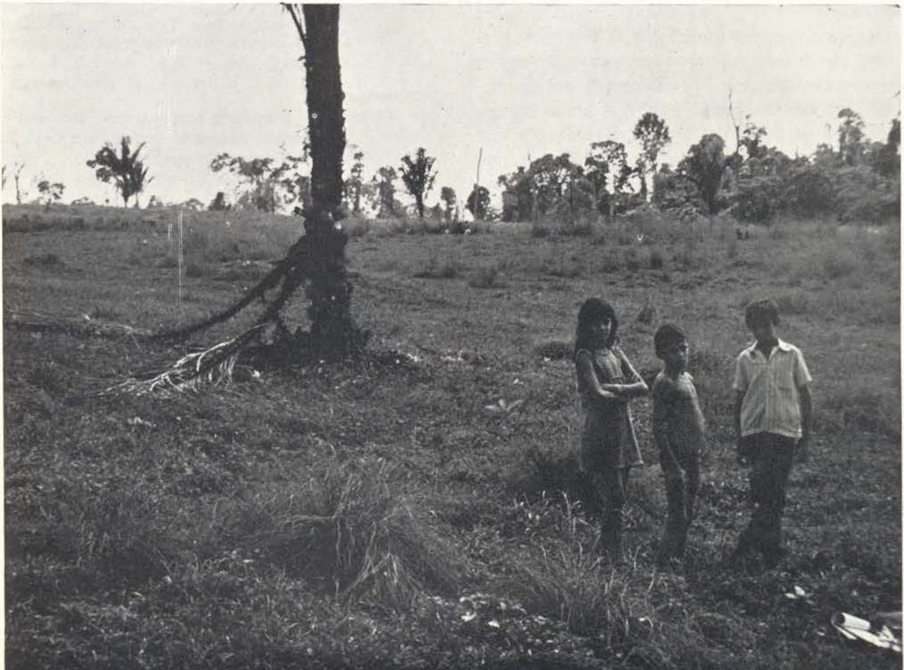
Fig. 5 — Pastagem velha, com baixa produção. Este campo, próximo a Altamira, Pará, foi derrubado pela primeira vez em 1933. Por ocasião desta fotografia ele tinha estado em pastagem por cinco anos, desde o seu mais recente período de pousio em capoeira. Tem estado quase completamente invadido por hortelã ( Lamiaceae ) não comestível.

mente. O fator chave do ponto de vista do empresário individual é o atrativo relativo aos investimentos alternativos tão logo ele esteja livre para reinvestir em outros locais. Depois de vender uma fazenda que deixa de ser produtiva, mesmo se for vendida por um preço mínimo, um empresário pode investir os lucros ganhos durante o período da sua posse ou em uma fazenda nova em outro local na Amazônia, ou em uma indústria diferente em outro local do Brasil, ou, no caso das corporações multinacionais, em outras partes do mundo. Clark (1976) mostrou a completa racionalidade matemática de indivíduos destruir os recursos potencialmente renováveis nos casos em que o índice de regeneração forem menores do que o índice de desconto usado no cálculo dos valores monetários atuais de rendimentos futu-