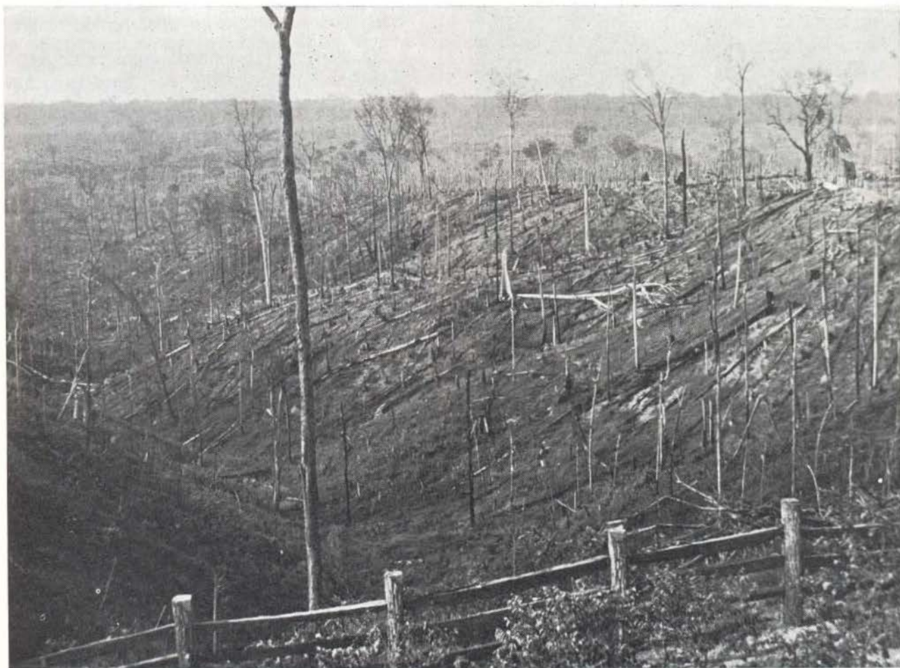
Fig. 2 — As grandes fazendas plantam o pasto logo após a derrubada. O crescimento inicial da pastagem é melhor do que nos anos posteriores face à fertilidade do solo mais alta e à competição reduzida com ervas daninhas invasoras.

comendado racionalmente .... para culturas perenes, reflorestamento e pastagens (IPEAN, 1974) com a observação de que é anti-econômico adubar culturas anuais. Em 1972, as mesmas observações, relativas a culturas perenes, reflorestamento e pastagens, são feitas juntamente com a impraticabilidade de adubação, mas a esperança para culturas anuais é apresentada através da citação de ensaios de variedades da EMBRAPA-IPEAN (Kass & Lopes, 1972) que são descritas como demonstrativas de "alta produtividade, usando como solo não somente o Latossolo Amarelo textura muito pesada, mas também de textura média, obtendo bons resultados experimentais, sem emprego de adubos e corretivos" (Falesi, 1972).