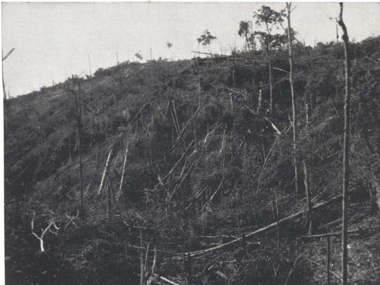
Fig. 1 — Grandes fazendas, tais como esta na Rodovia Paragominas-Tomé-Açu, derrubam a floresta pluvial tão rapidamente quanto os recursos financeiros permitem.

de 6 e o alumínio desaparecendo, persistindo esta situação nas diversas idades de pastos, tendo a pastagem mais velha a idade de 15 anos, localizada em Paragominas.