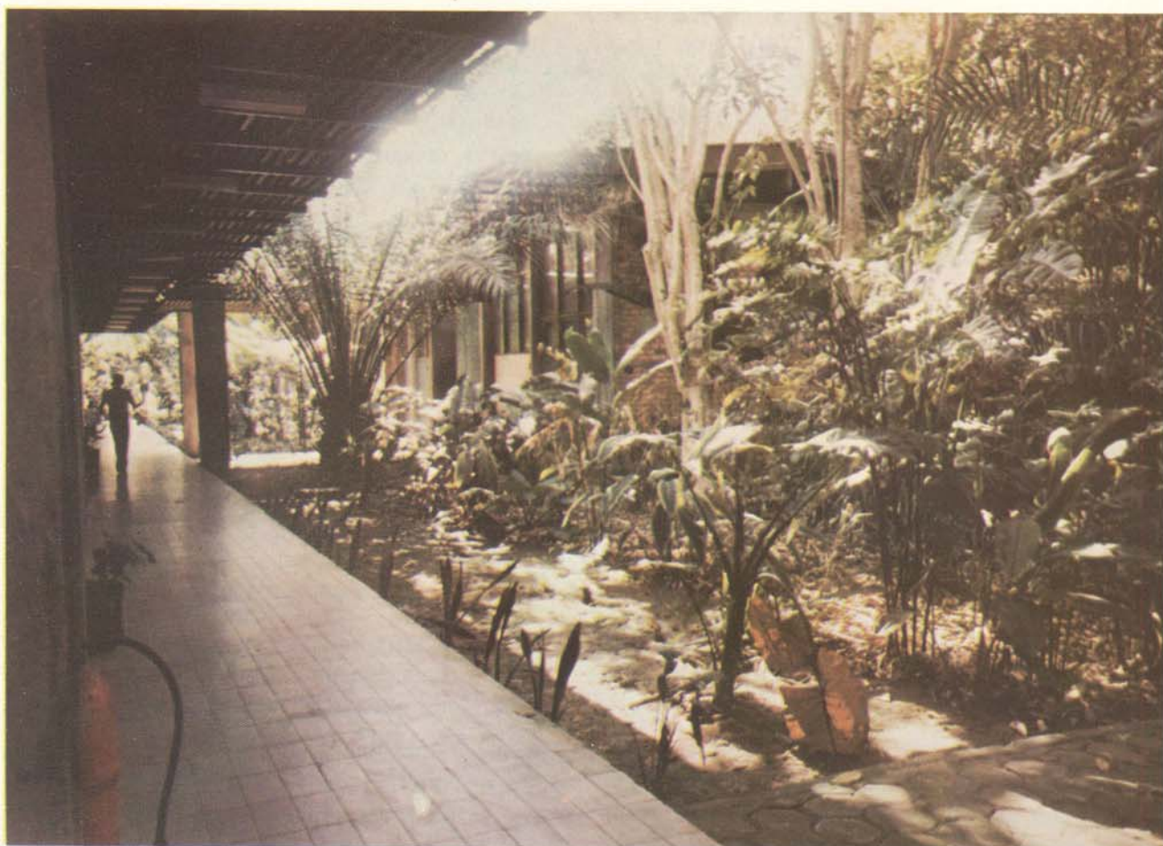
Fig. 1 — Vista atual do Departamento de Botânica.

O INPA como um todo e, em particular, a Botânica desde o início passou por várias crises financeiras e se ressentia de pessoal especializado. Em meados de 1956, por ordem do diretor do INPA na ocasião o Dr. Tito Arcoverde, todo o acervo do herbário do INPA deveria ser transferido para o herbário do Museu Goeldi, por não haver, na ocasião, nenhum botânico em Manaus. A transferência acabou não se consumando em virtude da readmissão, nessa