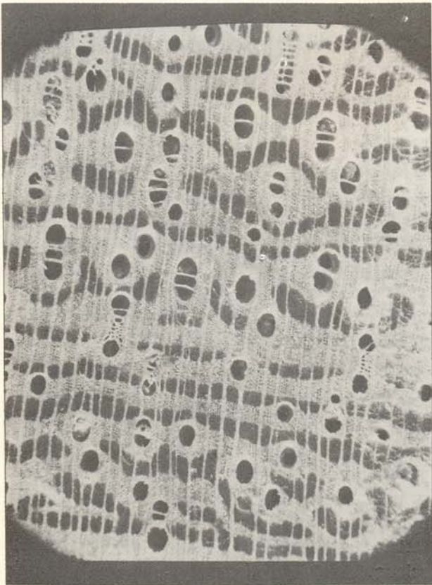
Fig. 5 — Secção transversal da madeira (10X).

Com a saída do seu fundador, o setor ficou sem elemento humano capacitado para os trabalhos de anatomia, quando em 1960 foi man-