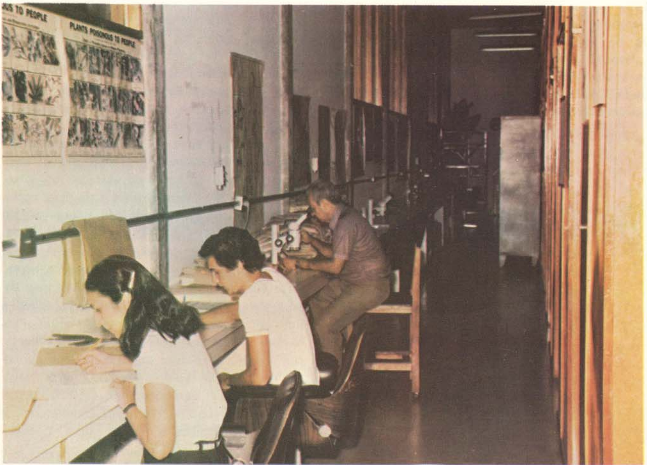
Fig. 3 — Vista interior do Herbário.

res e o envio de material a especialistas para estudo e identificação. Um quadro demonstrativo do incremento anual do Herbário do INPA é visto na Fig. 4. Nele é evidente as fases com maior ou menor disponibilidade de recursos (material e humano) refletidas nas aquisições de material. Nos últimos 5 anos, por exemplo, com a implantação do Programa Flora, quando foi firmado um convênio entre o CNPq e o National Science Foundation (NSF) através do New York Botanical Garden (NY), dinamizaram-se as coletas botânicas na Amazônia e nesse período, o Herbário foi acrescido de 24.000 amostras (incluindo-se doações), número este superior ao alcançado em 10 anos de trabalho.