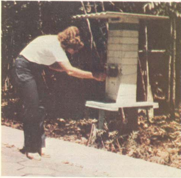
Fig. 6 — Coleta de néctar de abelhas no campus do INPA.

cecropiifolia , Theobroma grandiflorum , Annona muricata , Rollinia mucosa , e outras), em espécies florestais ( Pithecolobium racemosum ) e espécies de importância econômica, como por exemplo o "guaraná" ( Paullinia cupana ) e a "Castanha-do-Pará" ( Bertholletia excelsa ).