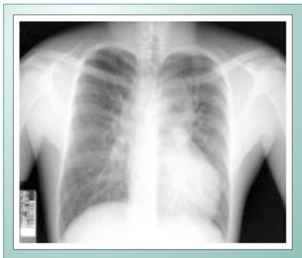
Fig. 1 - Radiografia em PA de Tórax mostrando o aspecto em “boneco de neve”. Mais detalhes no texto.

A taxa de hemoglobina estava em 17,7 g/dL e o hematócrito em 54,1%. O eletrocardiograma indicava ritmo sinusal, sobrecarga de câmaras direitas e bloqueio de ramo direito. A radiografia simples do tórax na projeção pósterio-anterior sugeria intenso hiperfluxo pulmonar, com alargamento do mediastino superior, compondo figura semelhante a “boneco de neve” (Fig. 1).