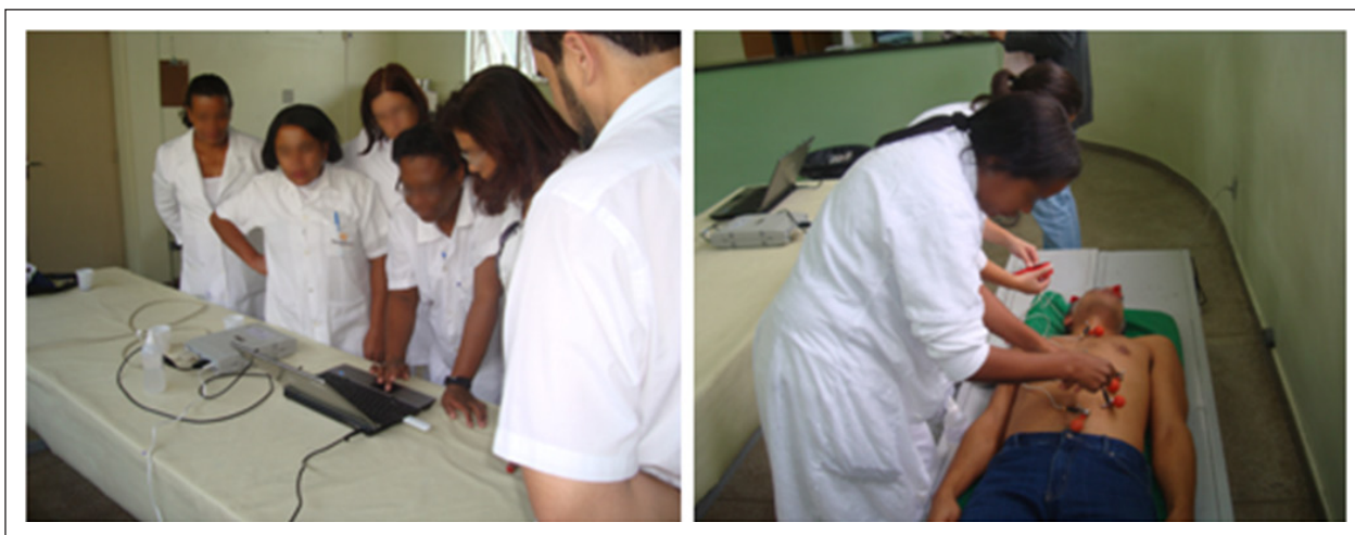
Figura 2 – Treinamento dos profissionais das unidades de pronto atendimento na realização e transmissão do eletrocardiograma digital.

Nos casos de pacientes com tempo de início da dor torácica > 3 h e < 12 h, ou > 12 h, porém apresentando dor recorrente ou refratária, ou em choque cardiogênico, o paciente segue a via rápida, na qual ele é encaminhado pelo SAMU diretamente ao laboratório de hemodinâmica para angioplastia primária, reduzindo o tempo de atraso para reperfusão. No caso de o paciente apresentar menos de 3 h de dor torácica, o médico da UPA é orientado a administrar trombolítico no local, salvo contraindicações, e posterior transferência o mais prontamente possível para UCO ou HAC. Essa transferência é regulada pela Central de Internações. Se, entretanto, após a infusão de trombolítico,