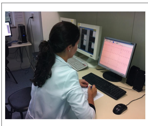
Figura 4 – Análise de eletrocardiograma digital de um caso de síndrome coronariana aguda com supradesnivelamento do segmento ST pela plantonista da unidade coronariana.

Os desfechos avaliados foram o número de internações por infarto e a mortalidade hospitalar por infarto, avaliados de 2009 (linha de base) a 2011. Foram utilizadas as informações do Sistema de Informações Hospitalares (SIH) referentes ao procedimento Tratamento do Infarto Agudo do Miocárdio, código SIH/DATASUS 03.03.06.019-0. Consideramos esse procedimento o mais representativo dos casos adequadamente