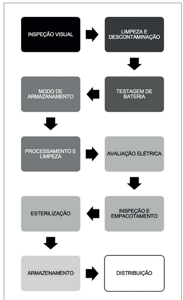
Figura 2 – Etapas reprocessamento.