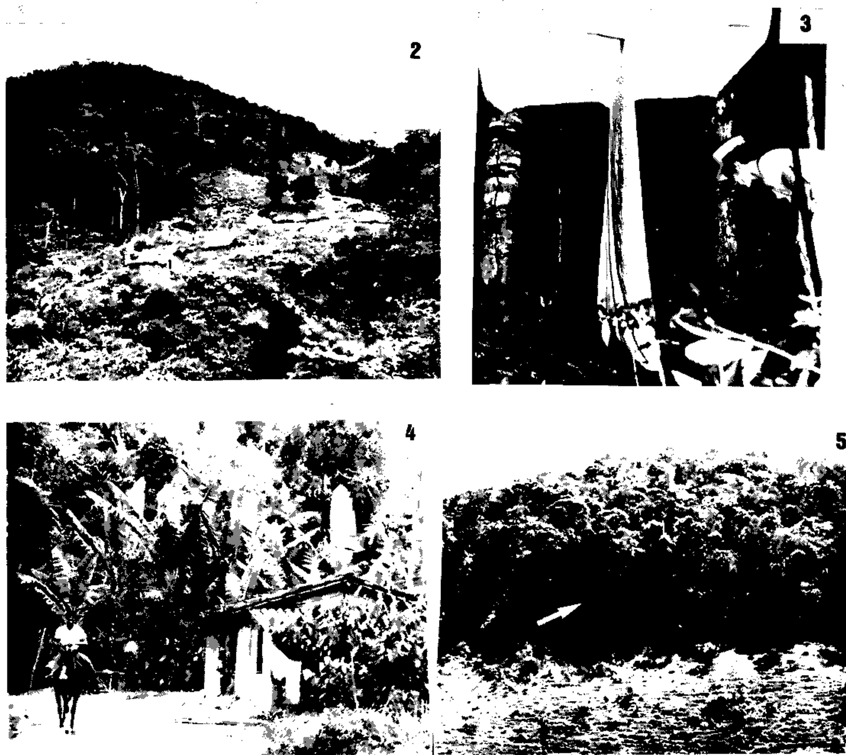
Fig. 2: situação típica da região. Casas construídas em clareiras bem próximas à floresta. Fig. 3: armadilha de Shannon modificada. Fig. 4: área peridomiciliar com plantações de banana e cacau, onde ocorre transmissão de leishmaniose tegumentar e alta predominância de Lu. whitmani . Fig. 5: área florestal onde foram capturadas 21 espécies de Lutzomyia com predominância de Lu. ayrosai , Lu. yuilli , Lu. fischeri e Lu. hirsuta .

Identificação e exame parasitológico de flebotomíneos — Os flebotomíneos coletados para identificação taxonômica foram preservados em álcool a 70%, diafanizados com lactofenol e montados em líquido de Berlese modificado (água destilada 50 ml, glicerina 20 ml, hidrato de clo-ral 50 g e goma arábica 30 g). A identificação das espécies foi feita levando-se em conta principalmente as características morfológicas das genitálias masculina e feminina e utilizando-se a nomenclatura adotada por Vianna Martins et al. (Martins, Williams & Falcão, 1978). Os espécimes coletados com finalidade de se observar infecção natural por Leishmania foram coletados vivos e dissecados em salina, observando-se cuidadosamente todo o tubo digestivo entre lâmina e lamínula.