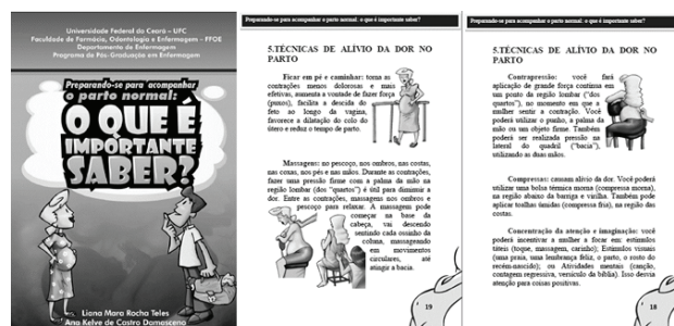
Figura 2 – Diagramação da capa e tópicos do manual educativo.

Ao final, o manual foi composto por 44 páginas e 38 ilustrações. Foram desenvolvidos dois personagens (a mulher e seu acompanhante) exclusivos para o manual, a fim de facilitar a visualização da sequência de acontecimentos. A Figura 2 apresenta a diagramação da capa e de um dos tópicos do manual.