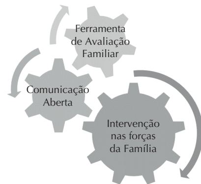
Figura 5 – Vantagens da aplicação do jogo – Porto, Portugal, 2017.

Os intervenientes descreveram vantagens na aplicação do jogo, tanto para o cuidador como para a família e para os enfermeiros, conforme ilustrado na Figura 5.