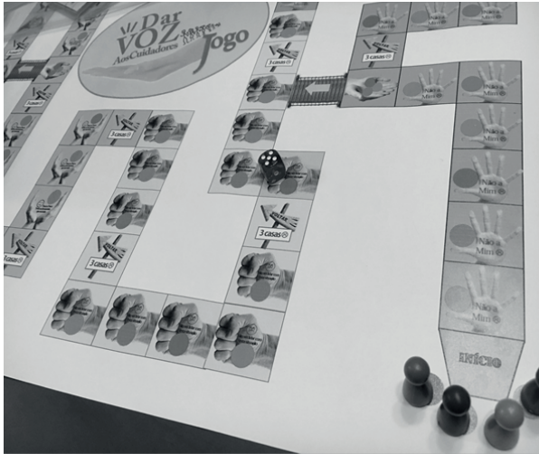
Figura 3 – Tabuleiro do jogo – Porto, Portugal, 2017.

O percurso do tabuleiro retrata as quatro fases no processo de se tornar cuidador familiar, designadamente: a negação, ou falta de consciência do problema; a procura de informação e o aparecimento de sentimentos negativos; a reorganização, e resolução (18-19) .