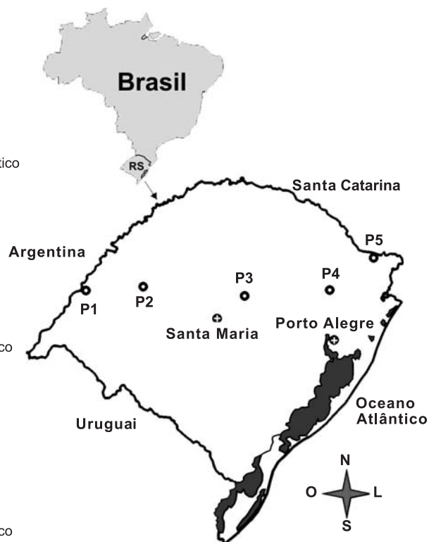
Figura 1. Características ambientais dos pontos amostrais. Dados climáticos extraídos de Buriol et al. (1979) e IPAGRO (1989); dados de vegetação natural extraídos de IBGE (1986) e classificação conforme Embrapa (2006).