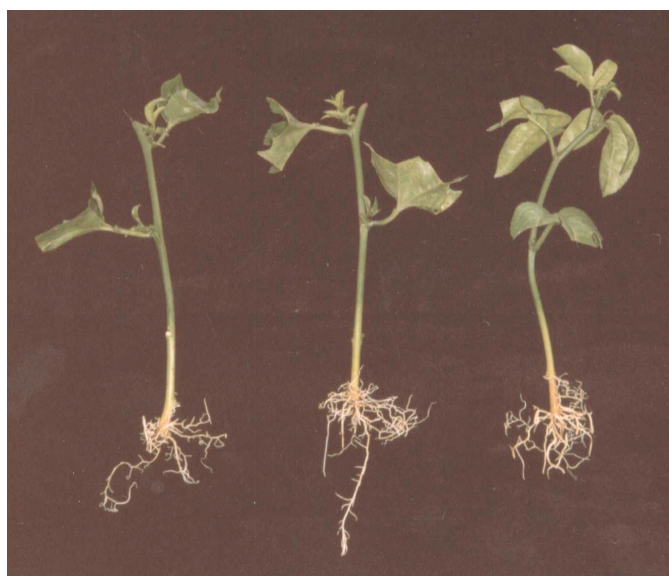
Basal Mediana Apical