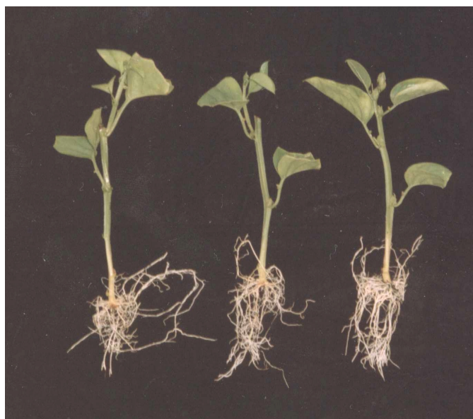
Basal Mediana Apical