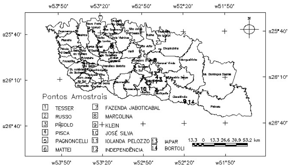
FIGURA 1 – Mapa político da região sudoeste do Paraná, com pontos representando os 14 sítios de ocorrência de jabuticabeira ( Plinia cauliflora ). UTFPR, Câmpus Pato Branco, 2009.