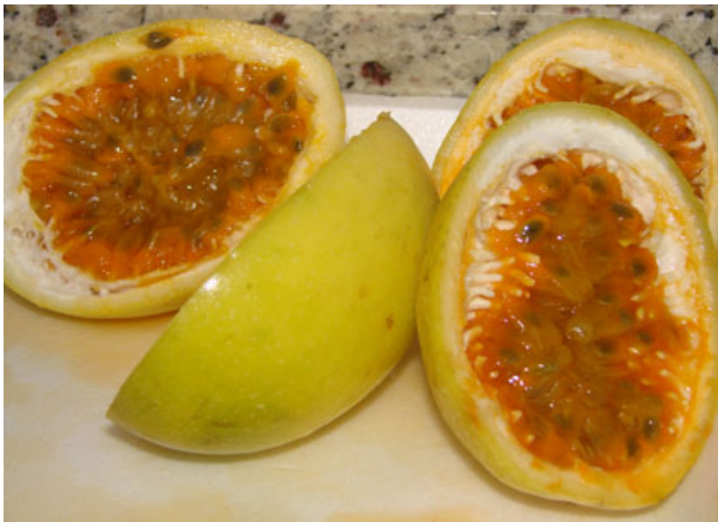
FIGURA 4 – Frutos da cv. IAC 275 (Maravilha), desenvolvidos para a agroindústria. Frutos com casca fina, cavidade interna completamente preenchida, alto teor de SST e maior rendimento em polpa.