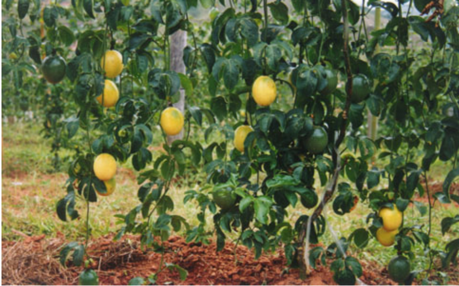
FIGURA 3 – Frutos da cv. IAC 277 (Jóia), desenvolvidos para o mercado de frutas frescas. Frutos homogêneos, alta produtividade (45 a 50 t/ha).