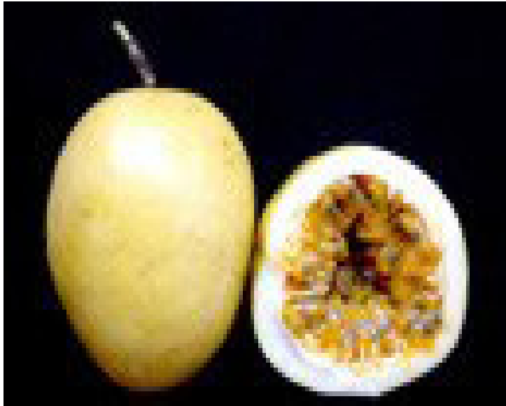
FIGURA 7 - BRS Sol de Cerrado.