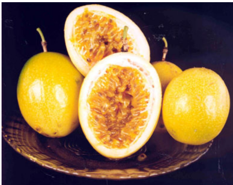
FIGURA 2 – Frutos da cv. IAC 273 (Monte Alegre), desenvolvidos para o mercado de frutas frescas. Frutos maiores e mais pesados, com homogeneidade.