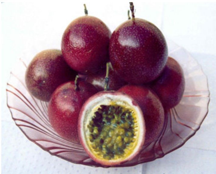
FIGURA 5 – Frutos da cv. IAC Paulista, maracujá-roxo. Frutos menos ácidos, desenvolvidos para exportação.