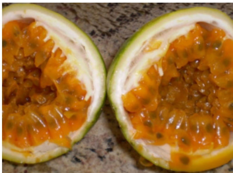
FIGURA 6 - BRS Ouro Vermelho é o híbrido de maracujá-azedo com maior quantidade de vitamina C.