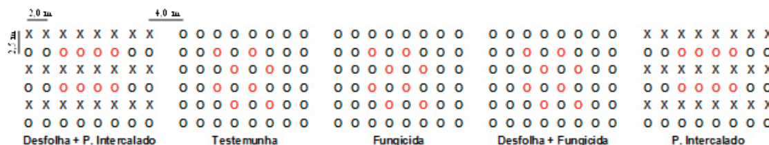
FIGURA 1- Disposição dos tratamentos na área experimental, Pariquera-Açu-SP, 2012. O: ‘Grande Naine; X: ‘BRS Thap Mao’; plantas avaliadas( em vermelho).

mesmo com todos os cuidados adotados no experimento, é difícil isolar de forma eficiente as parcelas sem a aplicação de fungicida, sendo qual foi fonte de inóculo da doença aos demais tratamentos.