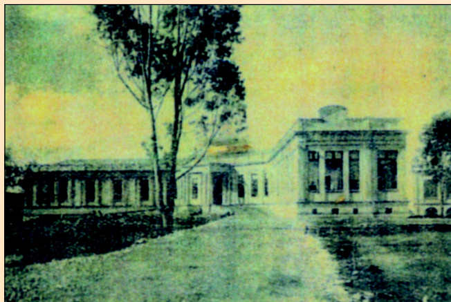
Institui de Radium de Bello Horizonte, Brésil. Façade principale.

Um momento marcante da história do Instituto foi representado pela visita de Marie Curie e sua filha Irène, em agosto de 1926. No dia 17 de agosto, após longa