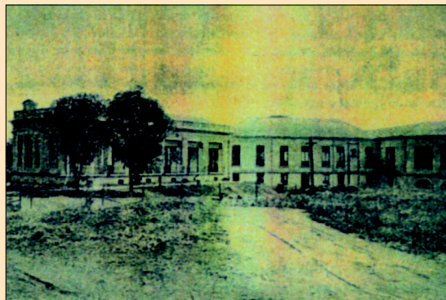
Institui de Radium de Bello Horizonte, Brésil. Façade latérale.

Figura 1. Fachadas principal e lateral do Instituto, publicadas no La Presse Médicale , de 20 de outubro de 1923, com um artigo do Dr. Borges da Costa.