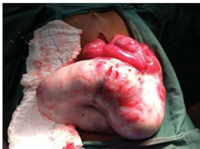
Figura 2. Peça cirúrgica. Imagem intraoperatória da laparotomia exploradora mostrando massa abdominal consistente com membrana fibrosa, espessa, branco-acinzentada, envolvendo alças de intestino delgado, contínua ao peritônio visceral, semelhante a um casulo.

a um casulo (Figura 2). Foram feitas remoção da cápsula e lise das aderências, além de enterectomia segmentar.