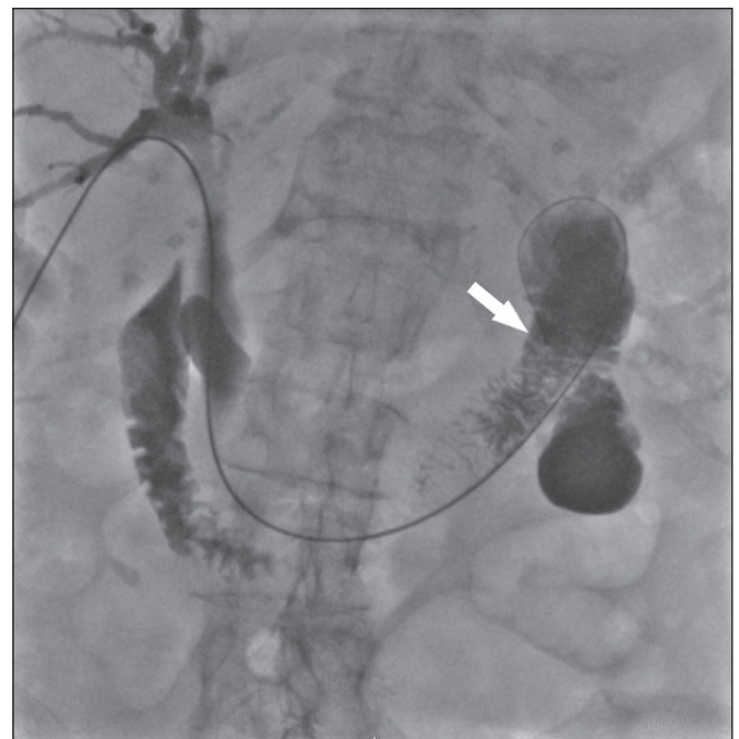
Figura 1. Fio-guia hidrofílico 0,035" e um cateter diagnóstico 5F com extremidade distal posicionada no duodeno, próximo ao ângulo de Treitz (seta).

Administra-se anestesia local com lidocaína 2% (10 mL) no ponto da punção percutânea, sob sedação consciente. Em seguida, faz-se a punção percutânea trans-hepática utilizando agulha coaxial 17G × 10,6 cm (MCX-S1816AX; Argon Medical Devices, Frisco, TX, EUA) e introdutor vascular radial 5F (RS+A50K10SQ Radifocus Introducer II; Terumo, Tóquio, Japão), guiados por ultrassom, de um ramo periférico da via biliar. Após esta etapa, realiza-se uma colangiografia para visualizar o local exato da obstrução. Procede-se então à transposição da obstrução com fio-guia hidrofílico de 0,035" e um cateter diagnóstico vertebral 5F (IMPULSE; Boston Scientific, Marlborough, MA, EUA), até que sua extremidade distal esteja posicionada no duodeno, preferencialmente próximo ao ângulo de Treitz (Figura 1). Distende-se todo o lúmen duodenal com cerca de 25 mL de contraste iodado