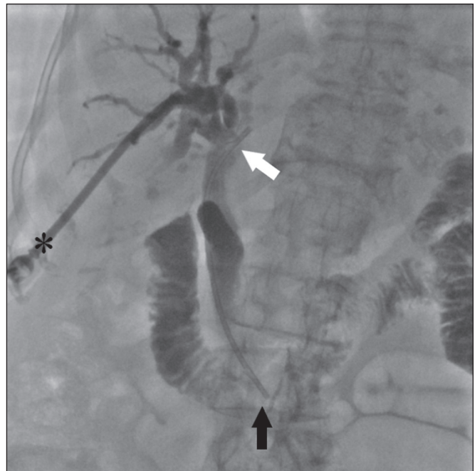
Figura 4. Após a retirada do sistema de entrega, injetamos pela bainha (asterisco) pequena quantidade de contraste iodado diluído e realizamos uma colangiografia pós-procedimento, com intuito de avaliar a perviedade e o posicionamento da prótese, com sua extremidade superior ao nível do ducto hepático comum (seta branca) e extremidade inferior ao nível do duodeno (seta preta).

do sistema de entrega da prótese, esta não mais poderá ser reposicionada. Como protocolo institucional, realiza-se um controle radiográfico de abdome 24 horas após o procedimento, para verificar se houve a eliminação completa do contraste intrabiliar.