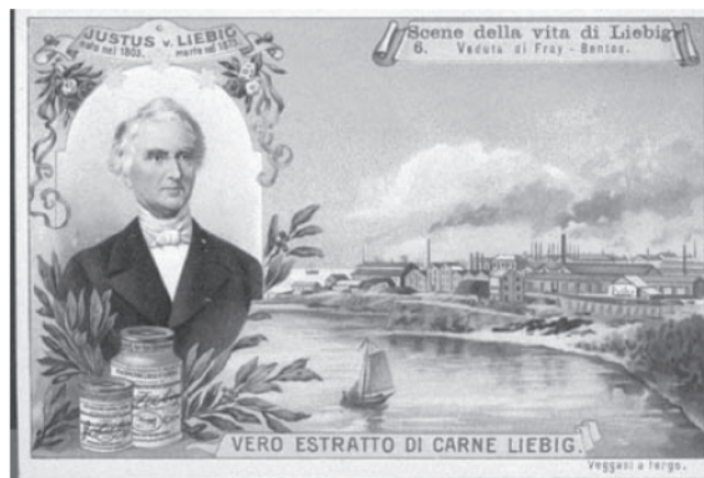
Figura 4. Vista das ilustrações da LEMCO, Liebig Extract of Meat Co., em Fray Bentos, no Uruguai, conforme ilustração em uma das mais de 11.000 Liebig Cards, distribuídas como material promocional junto com o extrato de carne.