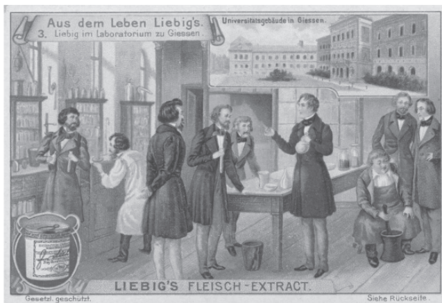
Figura 2. Uma das séries de Liebig Cards ilustra a vida de Liebig, como esta cena de Liebig com estudantes.